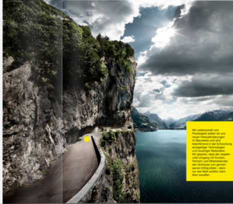
Das Landschafts- und Straßendesign ist ein Schlüssel zum Erfolg in Bauprojekten und wird immer stärker in der Entwicklung einflussreicher Technologien und Materialien. Mit diesem Design wird die Wahrnehmung des Kunden verbessert und die Produktion erleichtert. Aber wie wird es aussehen, wenn es ein bisschen anders wäre?

si, non non non non non non non non non non non non non non non non non non non non non non non non non non non non non non non non non non non non non non non non non non non non non non non non non non non non non non non non non non non non non non non non non non non non non non non non